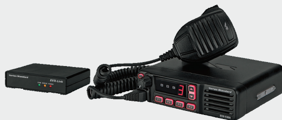
EVX-Link 和 EVX-5300